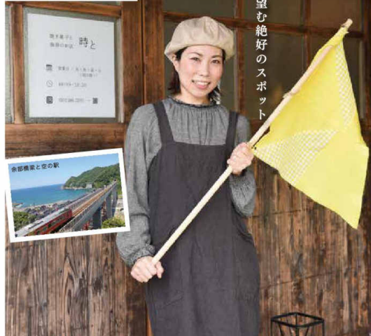
余部橋梁を望む絶好のスポット