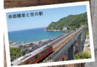
余部橋梁と空の駅